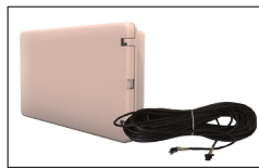
Kit de montaje a pared de 20 m (opcional) - HWX29400018