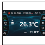
Nueva interfaz de usuario, intuitiva y muy informativa