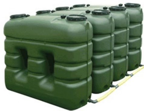
Batería de 4 tanques rectangulares de 3000L para redes contra-incendio.